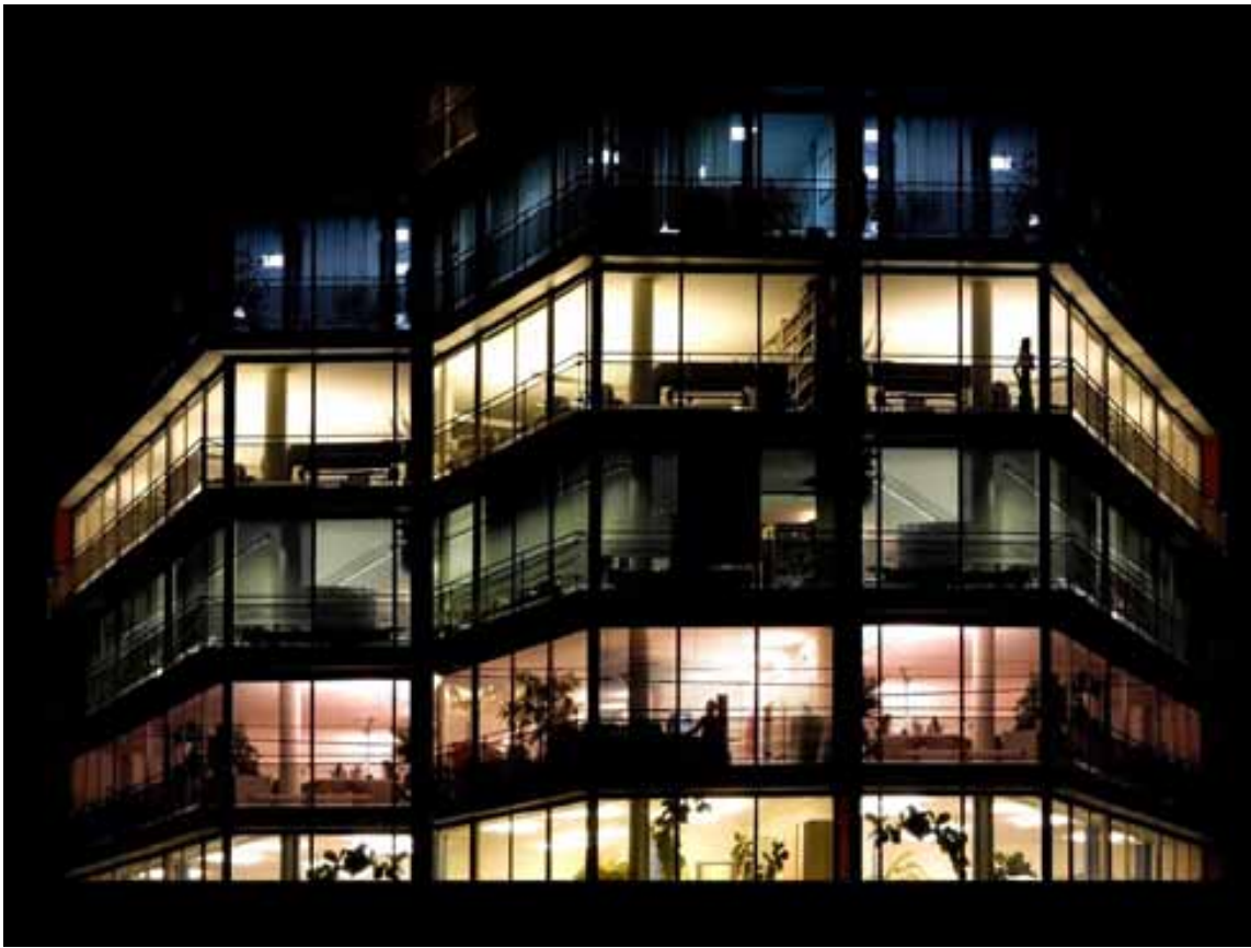
Immeuble #1 - 2006