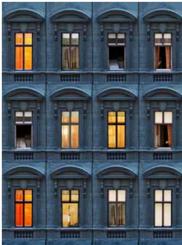
La chambre (60x80 cm)

Pour la série "des fenê-photographiées de nuit (les (les tranches de vie) il d'une seule fenêtre et du temps, de la vie des seule photographie. La enue immeuble, la vie