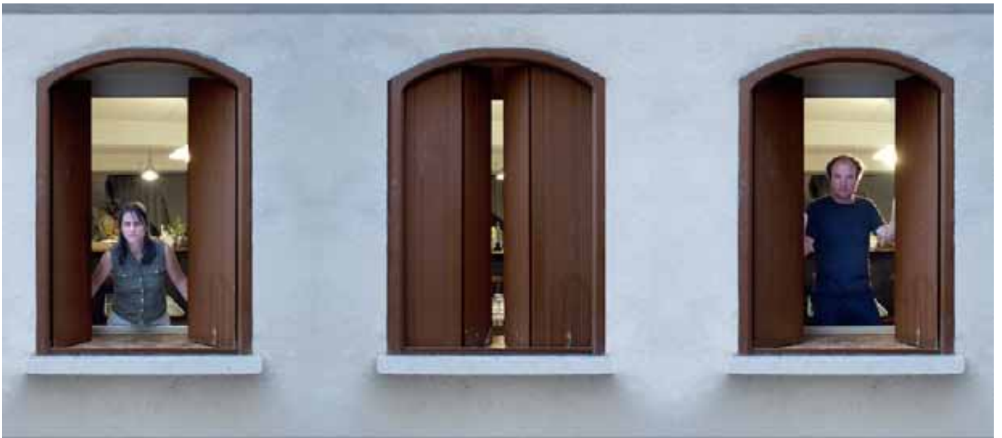
Détail - Tranches de vie - 2011 © Michael MICHLMAYR