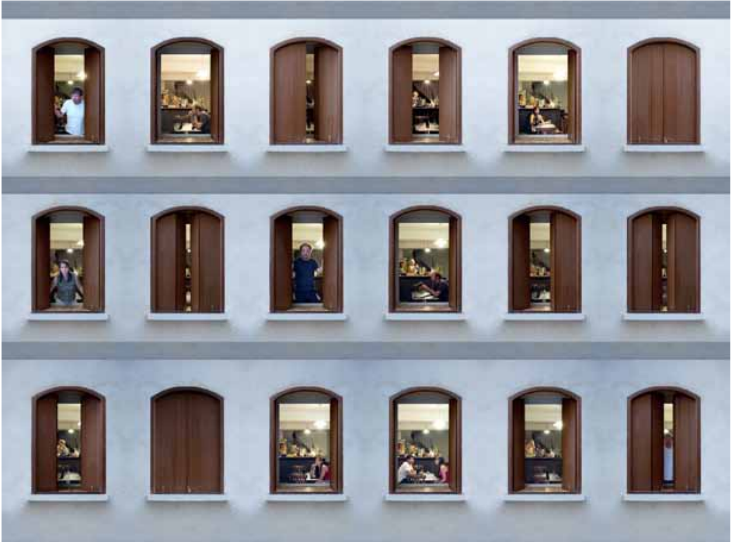
Tranches de vie - 2011