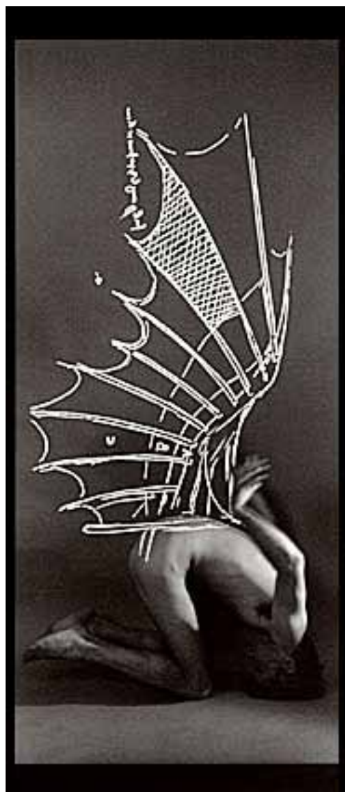
Série «Immagini Scoperte» - Jo Brunenberg

Extrait d'un texte par Drs. John van Cauteren Traduction par Mme Paola Kretzschmar