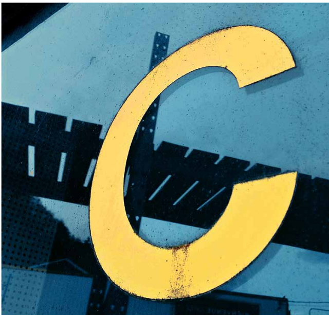
Série « ABC cherché, ABC trouvé »