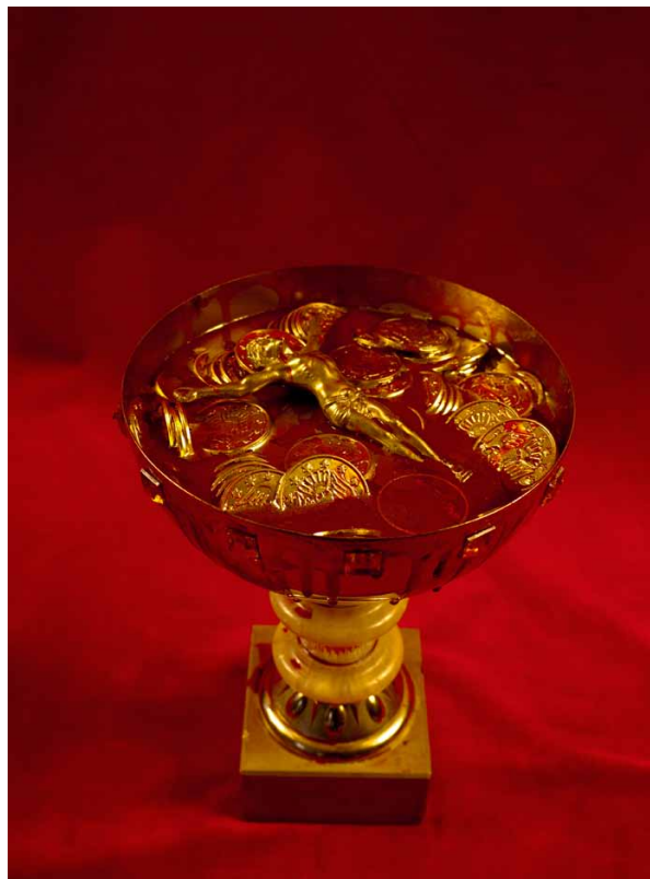
Banca Vaticana-2011

Mes images ne matoires, tout d'abord catholique, je suis athée. phème » n'existe pas ! C'est