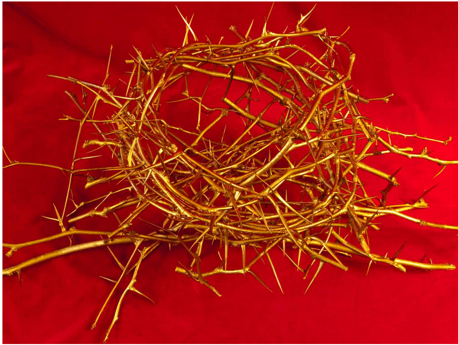
Décervelage 9 -2011

Photographies de presse en 300 DPI disponibles sur demande