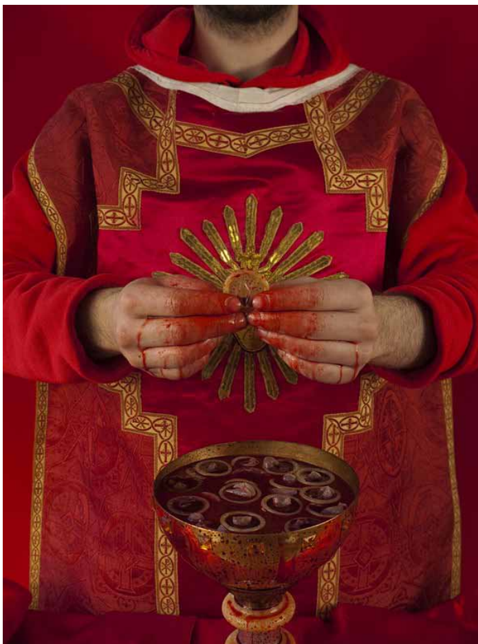
Pape Jean-Paul II 6-2013

Ce qu'ils pratiquent en deux séances de Parallèlement à cette sance de l'homme ou sexué et libre, cette sur les actes de milliers et répéta à l'envi sa l'homosexualité «Un le cardinal Ratzinger, Benoît XVI, montrant inelle hypocrisie. Rap- entre 1981 et 2005 le tion pour la Doctrine chargée de veiller à la des mœurs... On croit t-elle fait défiler dans «cathomophobes»