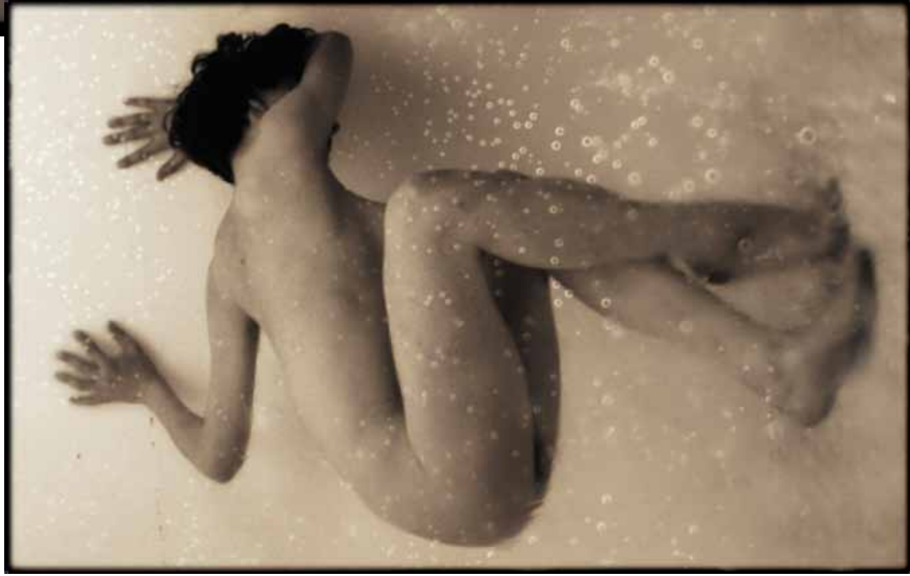
© - Luc EWEN - Lost memories - 2009