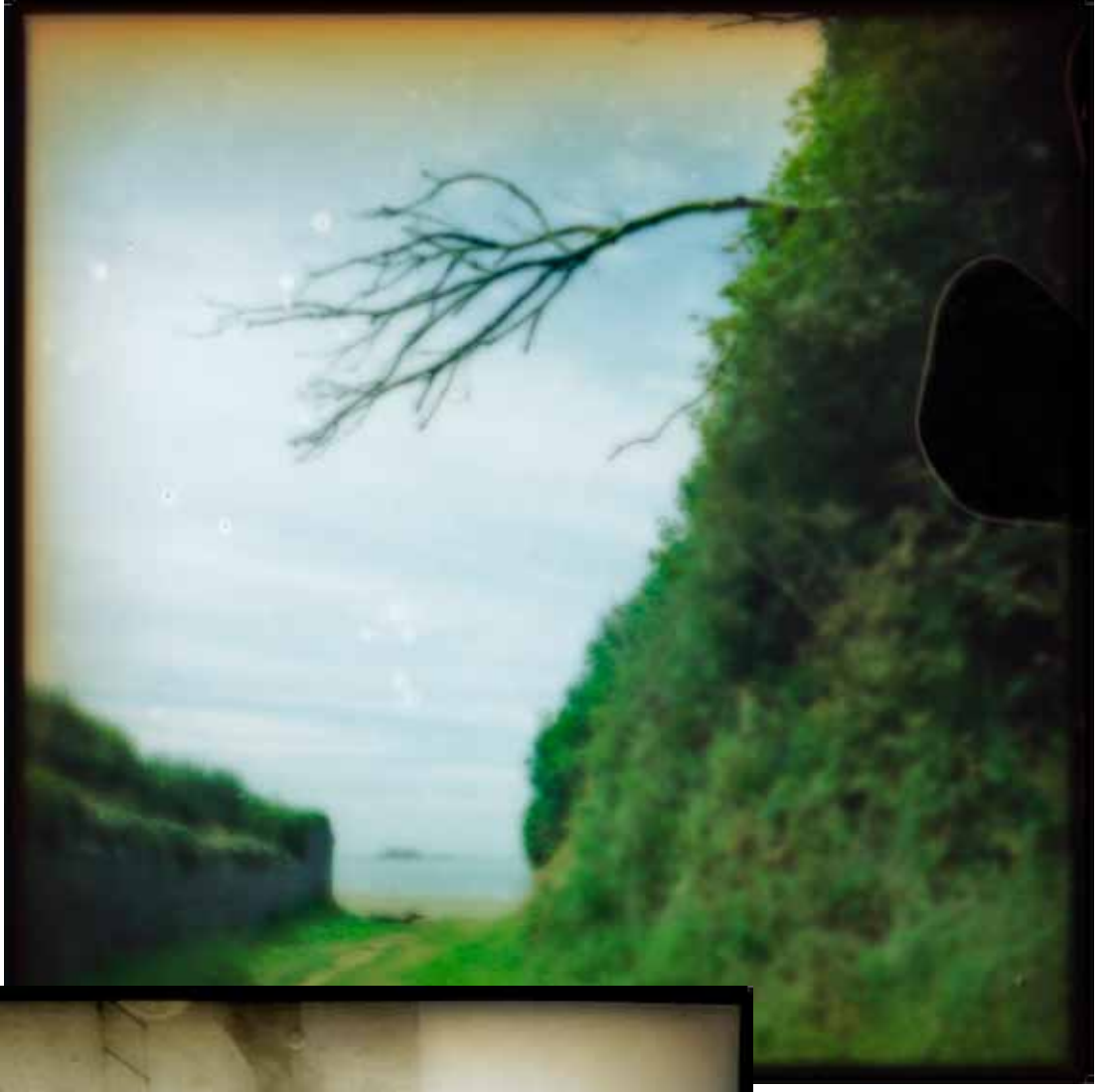
© - Luc EWEN - Lost memories - 2009