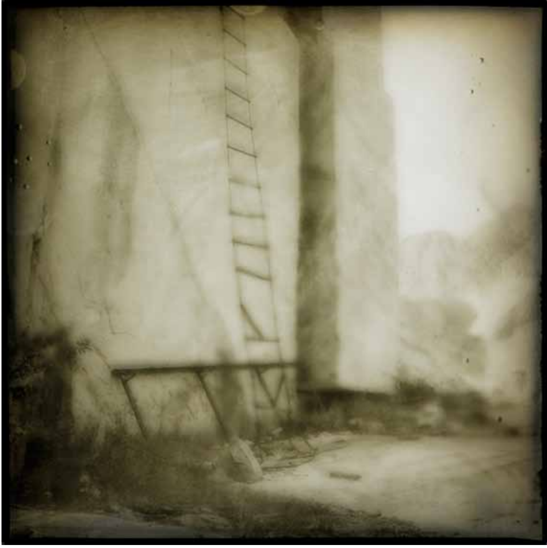
© - Luc EWEN - Lost memories - 2009